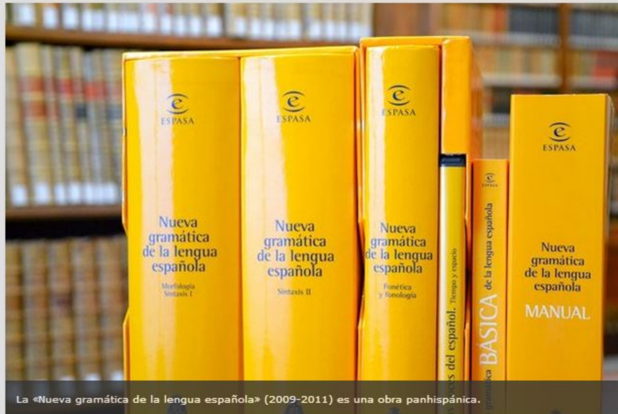
La «Nueva gramática de la lengua española» (2009-2011) es una obra panhispánica.